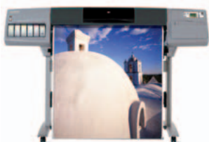
HP Designjet 5500 (107-cm-Modell)